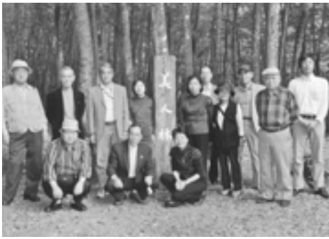
当日参加された皆さん

昨年創立二十周年を迎えた東京浦川原会は、秋も深まった十月十六日・十七日の両日、会の恒例イベントとなったふるさと訪問ツアーを実施。一行十六名が午前十一時にほくほく線の「うらがわら」駅に集結し、上越市浦川原区総合事務所のマイクロバスで各地を案内して頂いた。