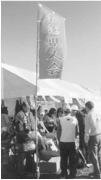
ふれあい店出店風景

今日は、一日限りの出展であったが、幸い晴天に恵まれ、松並木沿いの綾瀬川左岸広場は、今年全面的に