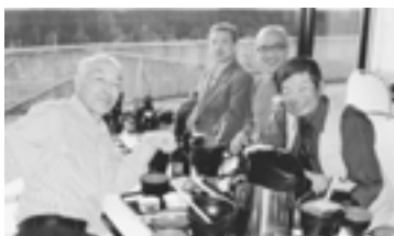
食事もたいらげご満悦

と黄金の湯があり、極楽楽の至福気分となります。夜は大広間での大宴会、山海の珍味が並び、信州蕎麦の実演の蕎麦が振舞われまし