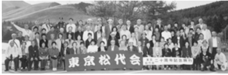
白樺湖にて20周年記念旅行 平成22年10月17日

横谷温泉郷は人里離れた山あいの傾斜地にあり、横谷旅館が一軒だけの温泉郷で周りには人家は無い。訪れた日は 十月十七日午前八時を過ぎる頃、私達にとつて心の故郷でもある上野駅の公園口改札に、遙か昔に越後よ