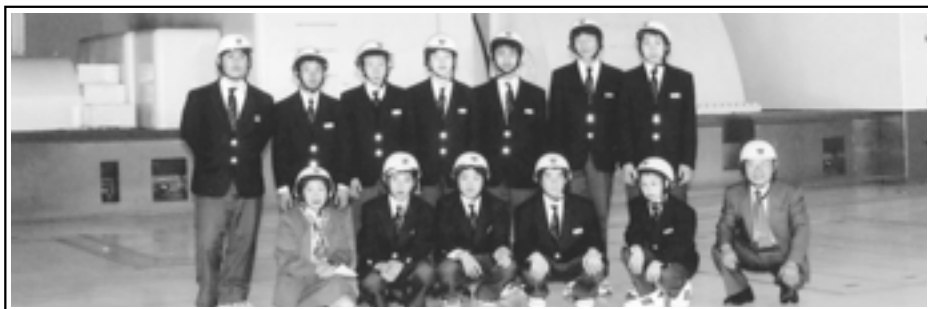
巨大なタービン・発電機の前で (前列左: 天野東京広神会副会長、前列右端: 筆者)