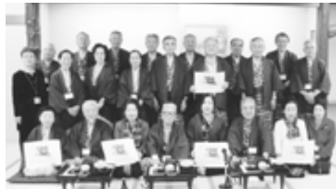
当日出席された皆さん