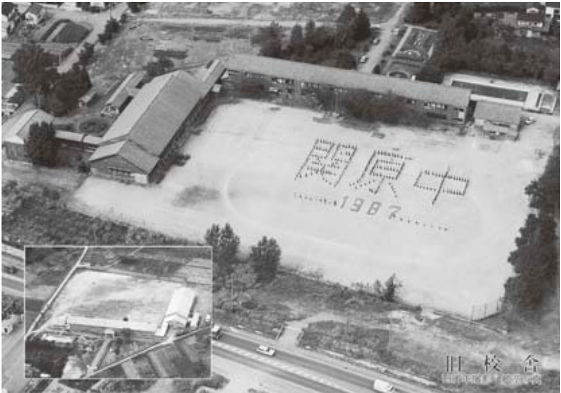
旧校舎 懐かしき校舎