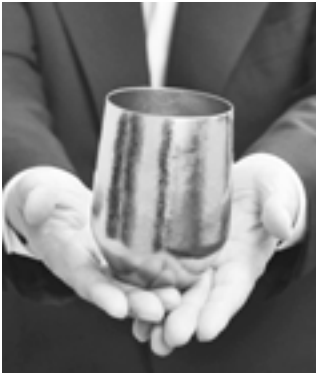
燕から世界へ

そして、その日の各国首脳による昼食会の席上、冒頭の乾杯が本県燕市で作られたチタン製のワイングラスで行われ、出席した方々に贈られた。