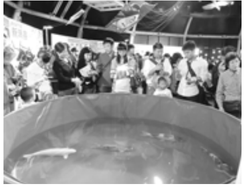
山古志の錦鯉は人気を集めた

ぶまれていたもので、新潟フェアの目玉として特別に許可されたもの。お互いに大地震を体験、四川大地震では復興への支援を通して中国政府や四川省との交流を深めて来た長岡市としては、この出展を輸入解禁へのステップにしたいところだろう。