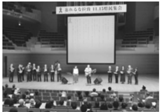
忘れるな拉致 県民集会

を採用し、内部が真空に作られたもので、保温効果・保冷効果がともに高く、飲みものの美味しさをそのままキープするすぐれもの。その表面は、雪の新潟を象徴するように雪の結晶風に仕上げられている。 東京のデパートなどで売られている同種の製品が外務省のAPEC担当者の目に留まったということ、メーカーのセブン・セブン社だけでなく、ここでもまた燕市の地場産業を世界にアピールし活気づける朗報として注目を浴びている。