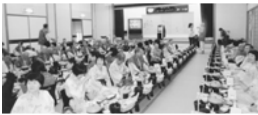
大広間も満員の大会

錦秋の紅葉にはまだ早く、僅かに「ななかまど」が黄色く色づいて秋の気配を感じさせられてくれた。露天風呂に入り夜空を見上げれば、山あいに満天の星と更科の煌々たる月を観ることも出来た。十月十七日午前八時を過ぎる頃、私達にとつて心の故郷でもある上野駅の公園口改札に、遙か昔に越後よ