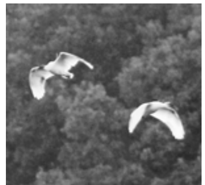
待望のペアリングは…

佐渡市のトキ保護センター野生復帰ステーションで行われたトキの第三次放鳥は、昨年十一月一日から六日間続けられ、予定していた十四羽