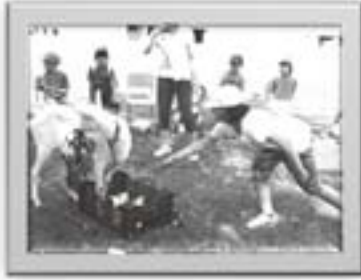
ヤギにえさを与える

学校の周りは広大な田んぼが広 がり、その上の上段は見渡す限り、 雪切れと同時に畑作を営む専業農 家が多い。そこで、地域の自然・ 人・文化に主体的にかかわる活動 を通して問題解決能力を育成する と共に、ふるさとのよさに気付き 誇りに思う心を育てていきたいと 思います。