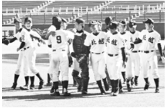
県大会で優勝した北越高校ナイン

田高校の間で争われ、新潟明訓高校が7対0で快勝。優勝の北越高校、準優勝の県央高校とともに北信越大会出場の切符を手中にした。