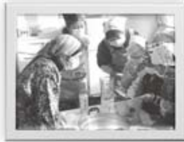
龍神豆腐をつくっているおばあさんが先生

○一・二年生活科 動物飼育を通して、 相手を思いやる気持ちと責任感・協 力する心を育てます。昨年の五月か ら、山羊を育て、冬も飼い続け、生 命の誕生との出会いが待っています。