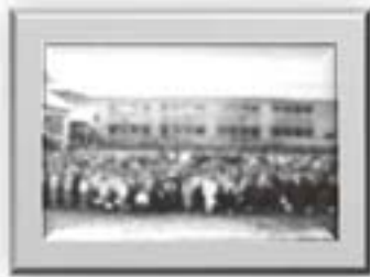
新校舎竣工式後の全校写真 (昭和4年9月 518名)