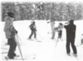
一日アルペンスキー教室：指導者はお父さん

○五・六年は福祉について、勉強してい ます。津南町は老人世帯が多く、介 護施設が足りないということを知り ました。自分たちにできることは何 かを考えて、慰問に何回か訪れまし た。