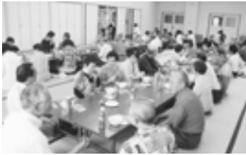
おにぎりが待ち遠しい(健康センター)