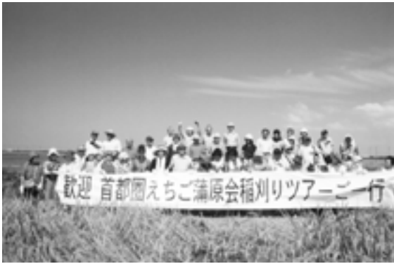
「さあ、やるぞー」と氣勢をあげる(西川地区)