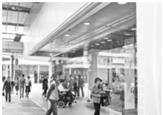
旧大和に出店した山下家具店の新店舗

その篠田市長のお膝元、県都新潟市では、古町通りの旧大和百貨店ビルの一、二階に新店舗がオープンした。三連休の初日となつた九月二十三日(秋分の日)、歩道を広げ道路の改修も成つた古町通りでは、街の再出発を祝うダンスなどのイベントが