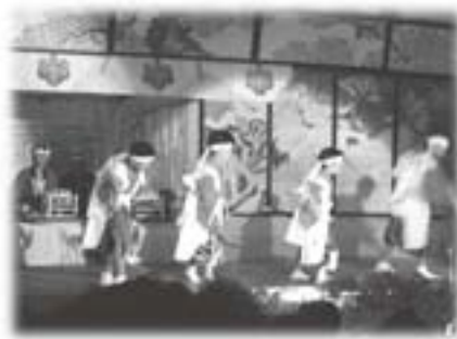
赤澤神楽（平成22年9月18日）

平成二十二年九月、多くの方々からご支援をいただき、三百年の伝統を誇る赤沢神楽を赤沢境内の特設舞台において盛大に上演することができました。