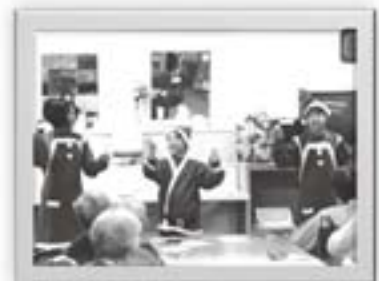
5年総合学習「ほくたちにできること」老人ホーム慰問

○冬の体育はクロカンスキー授業です。 学校にはスキーとストックが完備さ れています。 学校の周りの田んぼがコースとなり、 スノーモービルでコース付けを教頭 先生がします。先生方はスキーが初 めてでも、子どもと一緒に頑張って 練習します。 二月には五つの小学校がアルペン スキーとクロカンスキーの種目で競 合います。