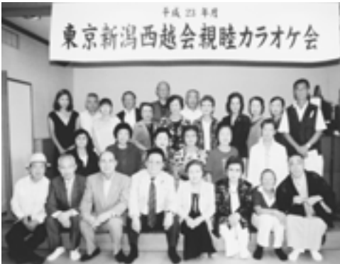
当日参加された皆さん