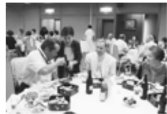
交流懇親会(岩室温泉)