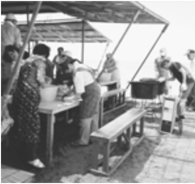
準備に一生懸命の会員さん