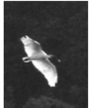
大けがから立ち直って飛び立ったトキ

続いて、トキである。来春こそは待望のヒナ誕生を…の願いを込めた五回目の放鳥が九月二十七日、二十八日の両日行われ、予定してい