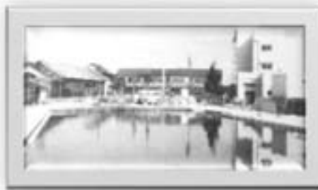
旧校舎と並ぶ新校舎 (昭和58年10月)