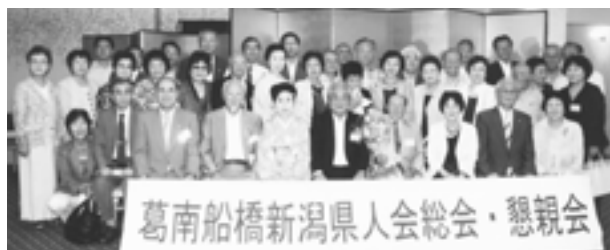
懇親会参加の皆さん