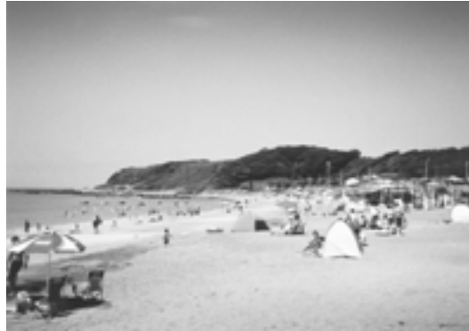
会場となった三浦長浜海岸