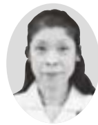
津南町立芦ヶ崎小学校 校長