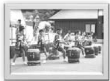
創立20周年を迎えた龍神太鼓演奏