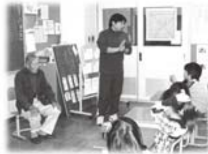
ヤギの飼い方について地域の方から話を聞く