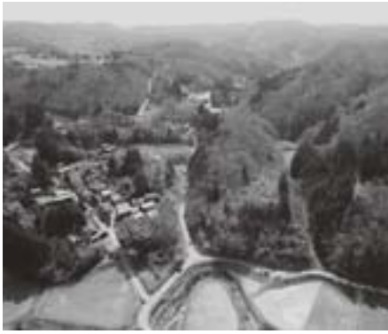
砂金採掘跡地に形成された笹川集落

受けた文部科学省が「佐渡西三川の砂金山由来の農山村景観」を国の重要文化的景観として選定（九月末）したのである。