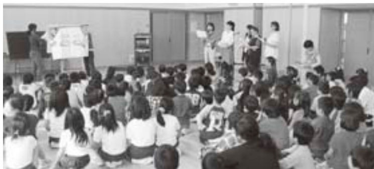
ボランティアによる自主活動「お話し会」

こうした取組の中で、子どもは学ぶ意欲を高め、次の学習を楽しみにしたり、「○○さんみたいになりたい。」と新たな目標をもって学習に臨んだりするようにになりました。