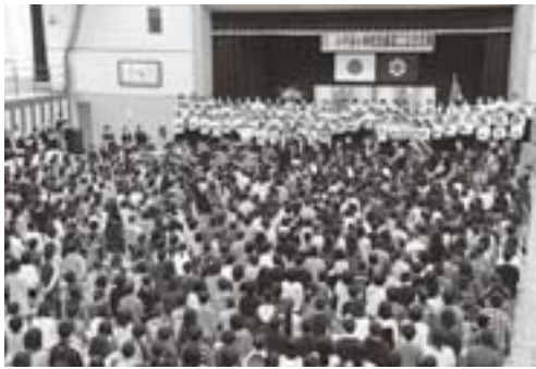
平成22年 新校舎竣工記念式典