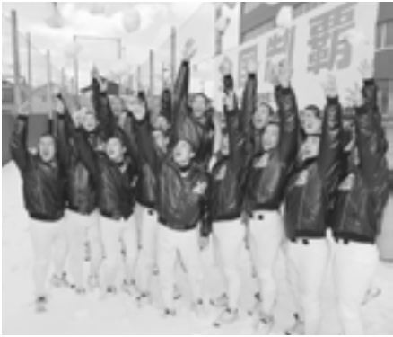
帽子を投げ上げて喜ぶ文理高ナイン