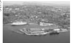
新潟西港

昨年末に行われた薫蒸倉庫の募集には全国から三十社の応募があり、八社が選ばれたのだが、その中に新潟市西港の日本海倉庫が入つている。（ほかに小樽市、酒田市、静岡市、四日市市、舞鶴市、福山市、熊本市の七倉庫）