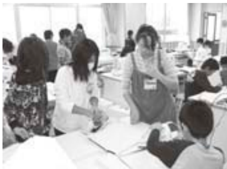
ミシン授業のボランティア