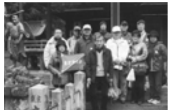
平成21年11月22日 秋のレクリエーション(東京・高尾山)

（意味は「人は皆いい人ばかり、それを信じて勇気をもって事を成せば必ず良いことがある。いい付き合いをしなければいけないです。」）