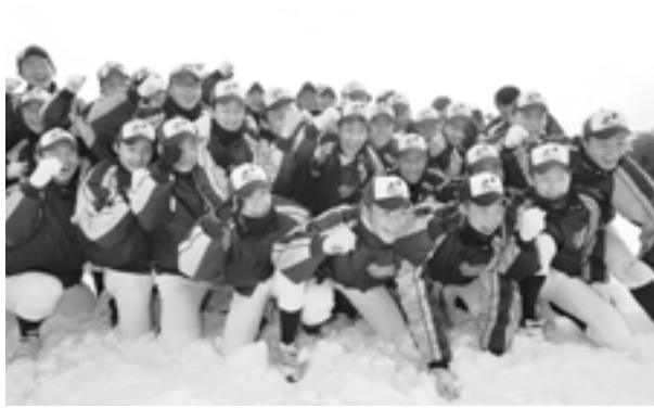
悲願遂に成り笑顔が弾ける佐渡高ナイン