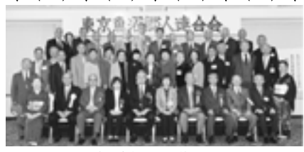
当日参加された皆さん

ふるさと魚沼市からは、大平悦子魚沼市長、志田アケミ市長公室次長も新幹線を利用して遠路かけつけてくれた。「東京魚沼郷人連合会」は、平成十六年町村合併により魚沼市が誕生したのを契機に、東京堀之内会、東京小出会、東京守門会、東京湯之谷会、東京広神会の各郷人会が横のつながりを更に深めようと組織した会である。