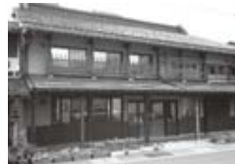
雁木通りにある高田小町

城北中学校の校区には、本町、東本町、大町、仲町と雁木通りのある昔ながらの風情が残るエリアがあります。豪雪地における町家が庇を伸ばして繋げることで、人が雪を避けながら街を歩ける独特の構造です。江戸時代から整備されたこの