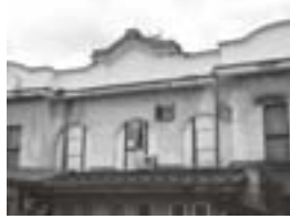
高田世界館 (旧高田日活)

れ、伝統的な暮らしの一端を伺わせます。また、通りを挟んで向かい側には、旧高田日活劇場が「高田世界館」として保存され、日本で最も古い現役の映画館として地