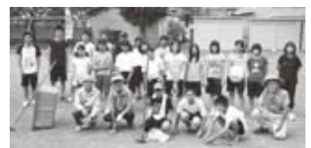
生徒会企画の地域貢献活動 昭和町2丁目

度の計画が選かった反省を踏まえ、今年度は春先に各町内生徒代表が町内会長を訪問し、連絡を十分取り合い、しっかりと計画で行うようにしています。町内