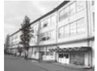
旧校舎と波形屋根

平成十八年十一月完成の新校舎には、その願いに応えるように、波形屋根とまわり階段が城北のシンボルとして受け継がれました。特にま