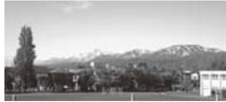
新校舎3階から南葉山と妙高山を臨む

学校の窓からは南葉山から妙高山までの美しい稜線が一望でき、また学校のすぐ近くには、青田川と儀明川が流れています。美しい自然の中、昔と今が混在するかのような校区と言えます。