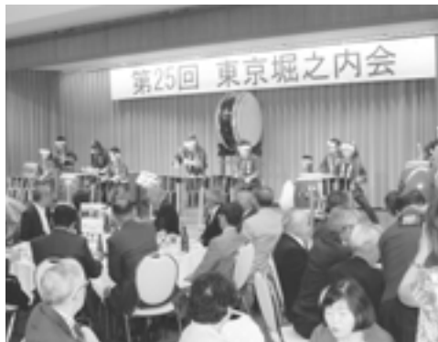
25周年を祝う鼓遊の寿ぎ太鼓