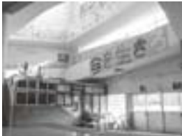
旧校舎のまわり階段

は建設当時、大変モダンな造りで、大きな鳥が舞い降りたような美しい外観を誇っていました。校舎の中