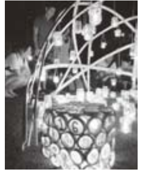
思いを伝えるキャンドルの火

避難している二千数百人を含めた今回の被災者支援にもこれまでの体験を生かして行きたいと表明した。