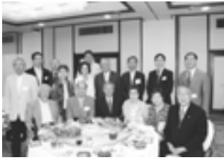
ご来賓の皆さま方と

この間、創立時に樹立した三本の柱(ふるさと訪問、現稲刈りツアー、ふるさとカレンダーの製作・頒布、ふるさとに関わる講演会開催)と、その後に加わった秋の歌舞伎町まつり協賛イベント、三月末に数日間催す新潟館ネスパスでの、蒲原から