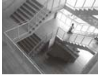
新校舎 まわり階段

わり階段では、定期的な生徒によるコンサートが開かれ、階段がそのままギヤラリーとなっていて、たくさんの生徒が演奏を聴いています。