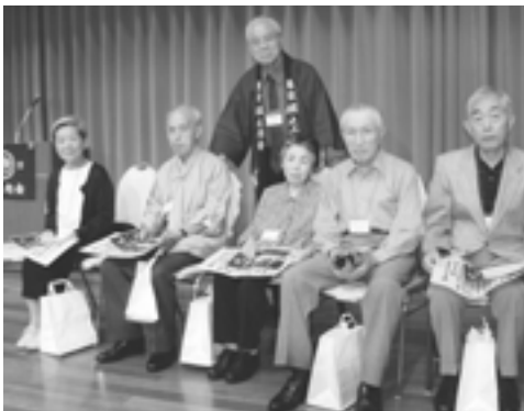
創立25周年皆出席表彰者