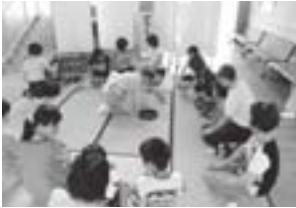
まわり階段下でお茶会

まず図書室では、地域の方が定期的に読み聞かせのボランティアをしてくださっています。中学生にも結構好評で、楽しみにしている生徒も少なくありません。また、城北中学校のシンボルとも言えるまわり階段下のスペースで、お茶会を行い、生徒だけでなく地域の方や子どもたちが参加して茶道に親しんでいます。