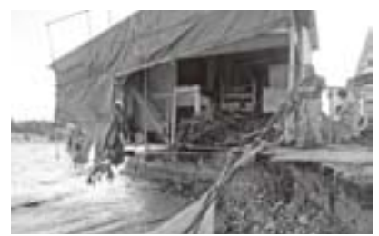
濁流に土台をえぐられた三条市の工場