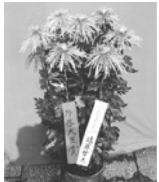
これぞ丹精の傑作

「菊は、面倒かけなきゃ結果が出 ない。手を掛けたら掛けたなりに花 になりますからね」、そこがいいと 彼は言う。