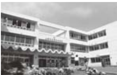
新校舎 新しい波形屋根

現在生徒は東本町小学校、飯小学校、大町小学校を中心に入學してきますが、最近では上越教育大学附属中学校や、新設された直江津中等教育学校、さらにはスポーツを目的に県外の中学校へ進む生徒があるなど、校区の小學生がすべて城北中へ進学するとい