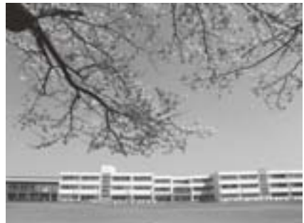
春、グラウンドから見える新校舎