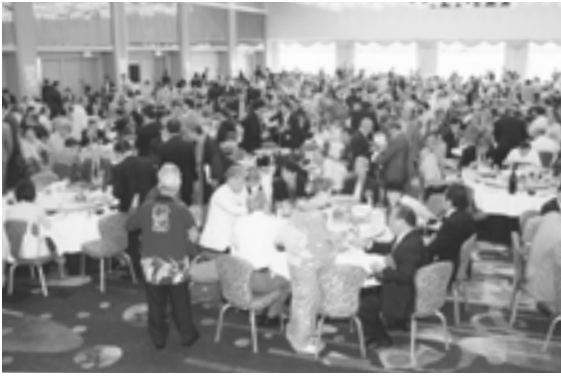
なでしこに沸いた納涼大会

このビッグニュースが克明に伝えられるたびに場内が沸いた。ドイツのフランクフルトで行われ